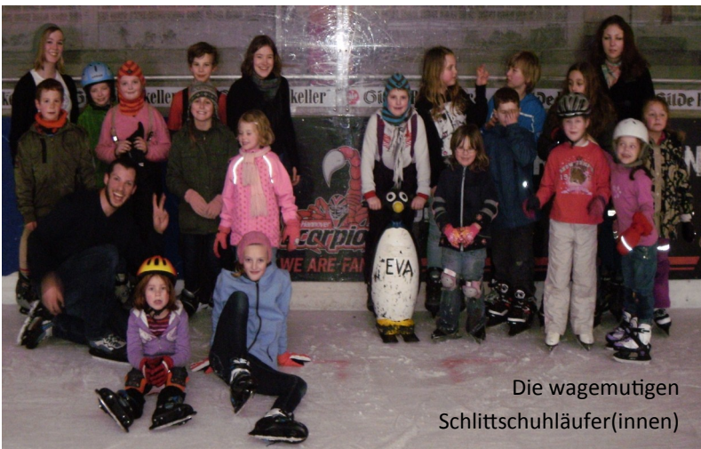
Die wagemutigen Schlittschuhläufer(innen)