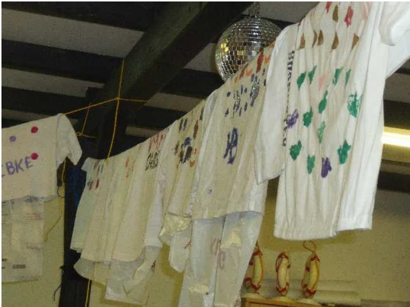
Die Ergebnisse des Tages

Danach war es Zeit für ein paar Gesellschaftsspiele wie, „der Plumpsack geht um“ und vieles mehr. Währenddessen wurde mit der Hilfe von ein paar Kindern Spaghetti Bolognese gekocht. Nach der anstrengenden Arbeit wurde ordentlich gegessen. Schließlich war es leider schon so spät, dass die Kinder mit samt den T-Shirts abgeholt wurden.