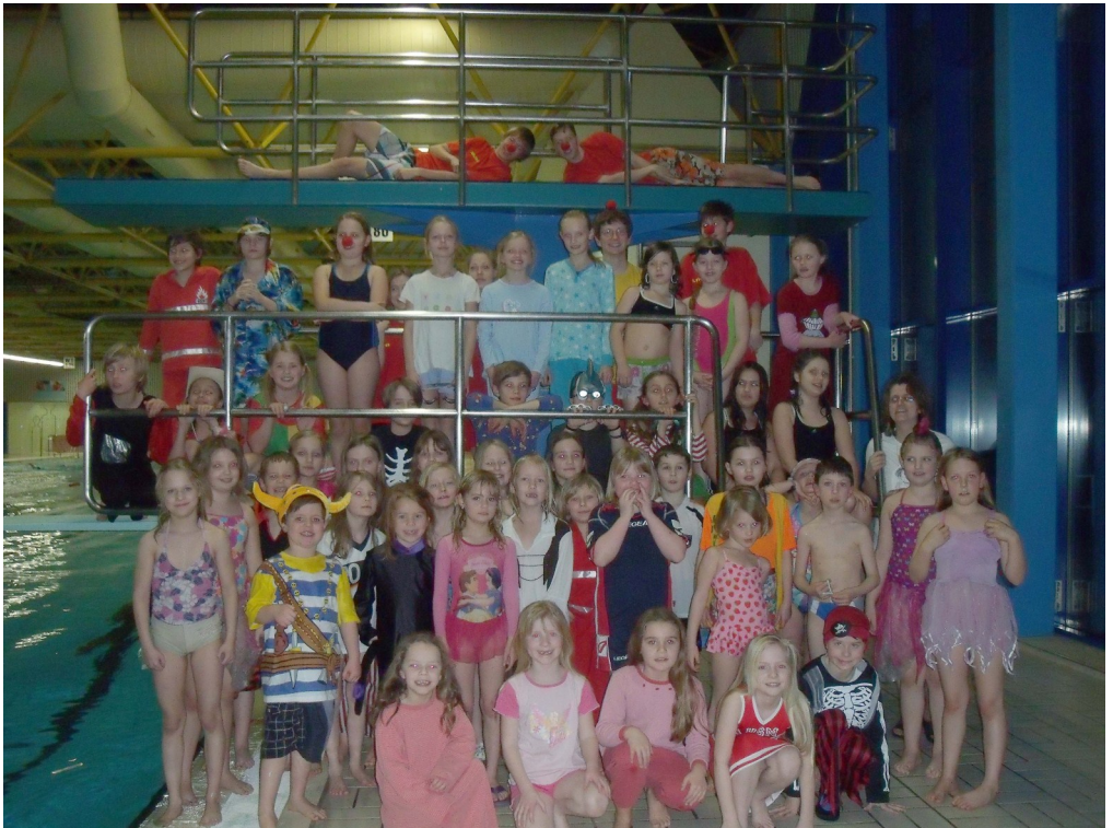
Die verkleideten Schwimmkinder

Wir alle freuen uns auf das kommende Jahr und eine Wiederholung der ganzen Aktion!