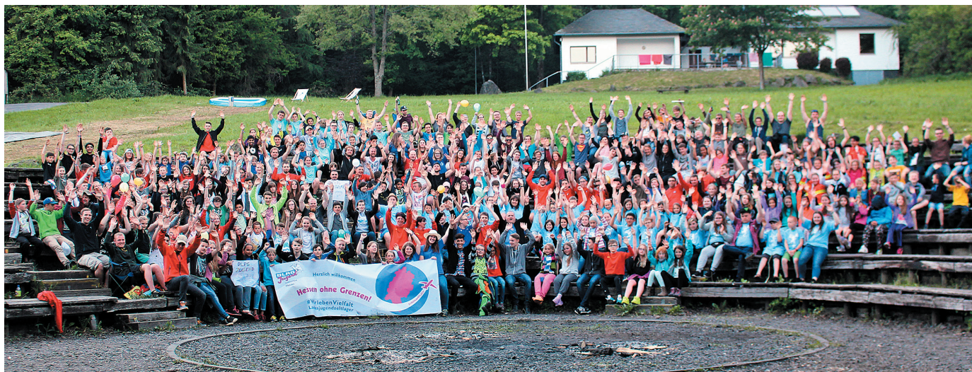
Zeltlager der Vielfalt: Über 320 Kinder, Jugendliche und junge Erwachsene aus ganz Hessen mit unterschiedlichsten Wurzeln.