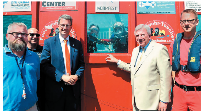
Innenminister Volker Bouffier und der Rüsselsheimer Oberbürgermeister Patrick Burghardt besuchten den Tauchcontainer am Platz der Hilfsorganisationen.

Der Hessentag 2017 mit 1,4 Millionen Besuchern stellte die Wasserretter der DLRG Rüsselsheim vor eine besonders große Herausforderung. Zentrale Teile des Veranstaltungsgeländes lagen direkt am Mainufer. Damit ging einher, dass die DLRGler dort zehn Tage lang von morgens bis teilweise spät in die Nacht mit zwei Booten zur Absicherung vor Ort waren. Tatkräftige Unterstützung kam dabei aus Main-Kinzig und Darmstadt-Dieburg. Zusätzlich präsentierte sich die DLRG Rüsselsheim gemeinsam mit dem Kreisverband Groß-Gerau auf dem Platz der Hilfsorganisationen, wo unter anderem in einem Tauchcontainer der Druckkammerzentren Rhein-Main Vorführungen der Einsatztaucher stattfanden. Die Helfer leisteten während des Hessentages über 2.500 Dienststunden, 81 Aktive waren zehn Tage lang im Zwei-Schicht-Betrieb im Einsatz und sorgten nicht zuletzt für die Besetzung des gemeinsamen Standes der Hilfsorganisationen und die Durchführung des Kindergarten-Projektes. Alles in allem eine tolle Veranstaltung und eine beeindruckende